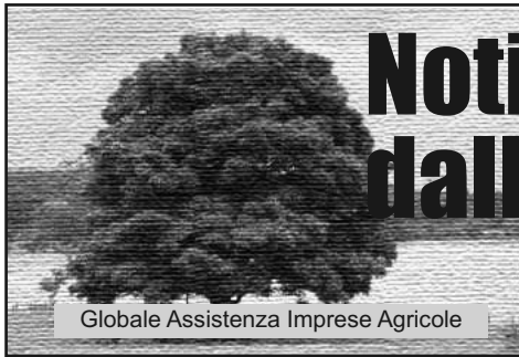
Globale Assistenza Imprese Agricole